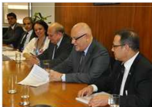
Imagem 1 / 1