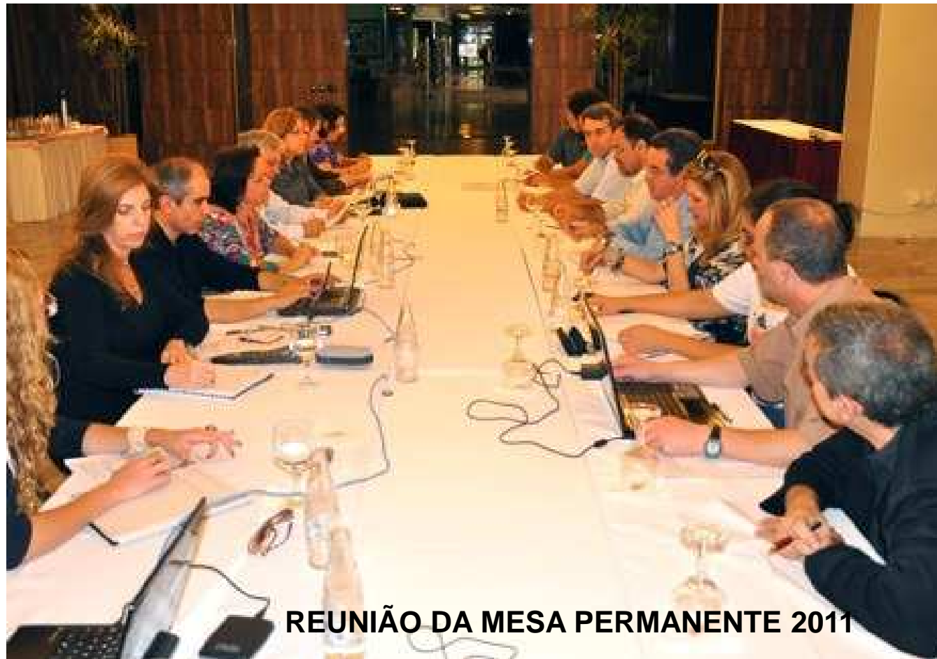
REUNIÃO DA MESA PERMANENTE 2011