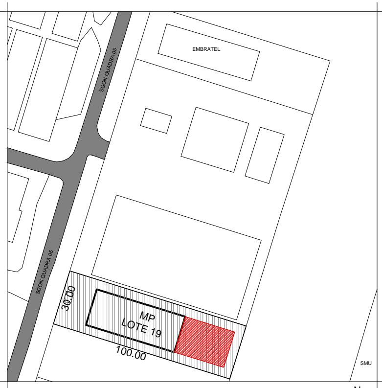
SITUAÇÃO Escala: 1:500