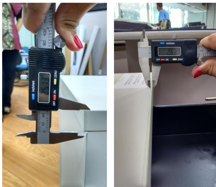
Figuras 07 e 08 – Tampo do Gaveteiro.

O tampo do gaveteiro apresentado é confeccionado em MDP com espessura de 25mm, com acabamento em laminado melamínico texturizado e bordas retas, com fita de poliestireno de espessura superior a 2,5mm.