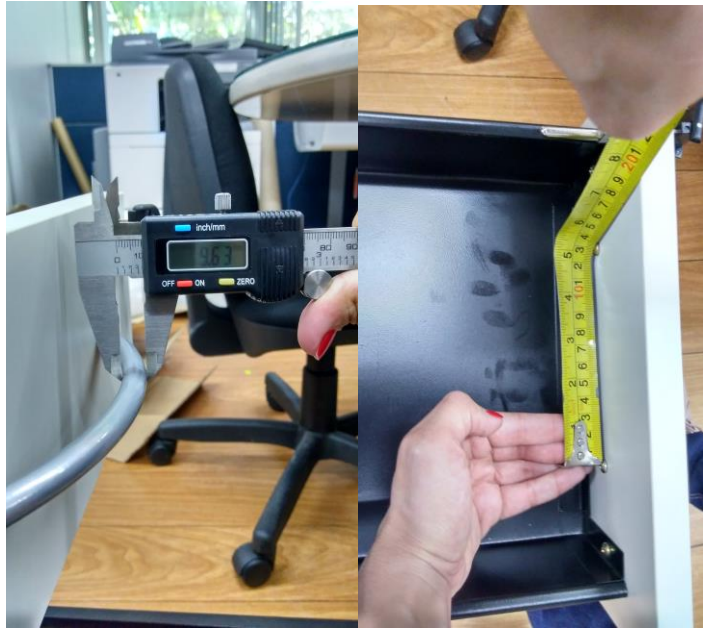
Figuras 24 e 25 – Puxador com dimensões corretas, porém com acabamento pintado fosco, ao invés de cromado.