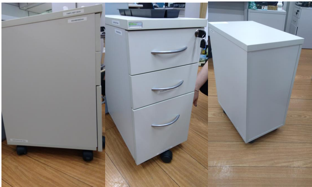
Figuras 09, 10 e 11 – Laterais e Fundo do Gaveteiro.

A base, fundo e laterais do gaveteiro apresentado são confeccionados em MDP com espessura de 18mm, com acabamento em laminado melamínico texturizado e bordas retas, com fita de poliestireno de espessura superior a 1 mm. A montagem das peças se utiliza de acessórios internos e há quatro rodízios fixos no corpo do gaveteiro, que atendem ao especificado em Edital. Porém, a frente da gaveta inferior não cobre o gaveteiro até o limite das peças da base (qual seja, os rodízios).