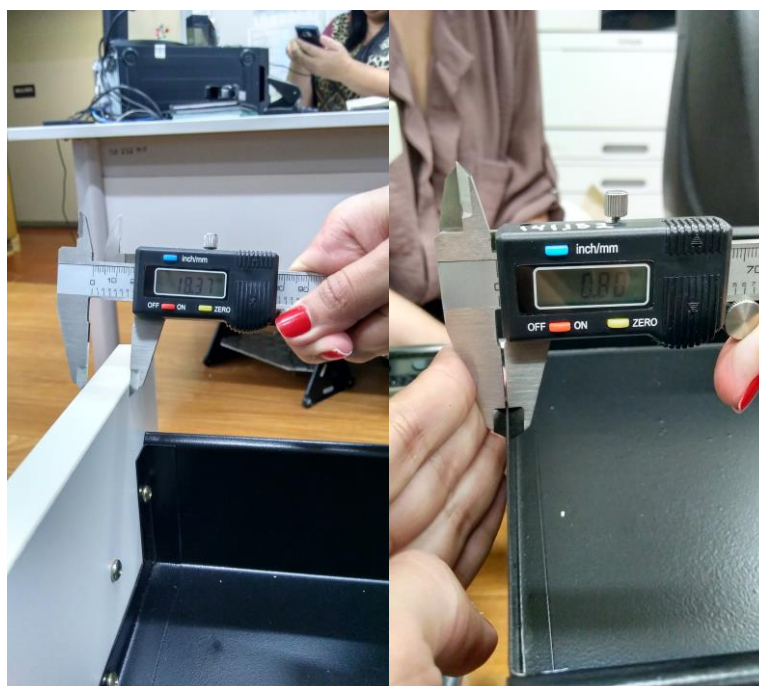
Figuras 17 e 18 – Caixa em aço com 0,80mm e frente em MDP de 18mm.