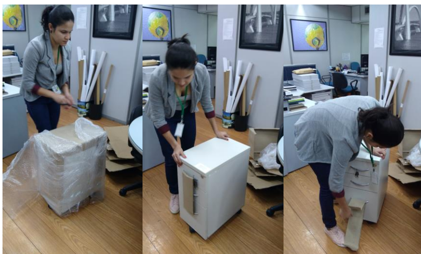
Figuras 01, 02 e 03 – Abertura do pacote embalado às 10h, desta data.