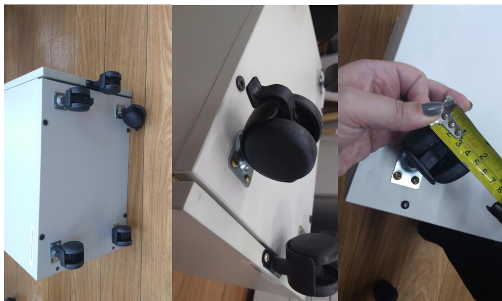
Figuras 12, 13 e 14 – Fundo com 04 rodízios, com 50mm e dispositivo de freio.