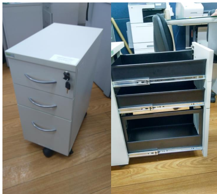
Figuras 15 e 16 – Gavetas fechadas e abertas. O gaveteiro não tomba com as três gavetas abertas e a lateral da última gaveta é incompleta.

A frente das gavetas está confeccionada em MDP de 18mm com acabamento em laminado melamínico texturizado e bordas retas, com fita de poliestireno de espessura superior a 1 mm. A gaveta inferior possui o 5º rodízio solicitado para evitar o tombamento do gaveteiro. Porém, as gavetas estão confeccionadas em aço com espessura de 0,80mm e não de 1,20mm como solicita o Edital e, ainda, a última gaveta não possui caixa interna de altura equivalente a altura da gaveta, o que pode fazer com que objetos caiam ao se abrir a gaveta.