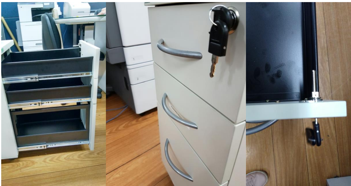
Figuras 21, 22 e 23 – Corrediças e fechadura em conformidade com o Edital.

As gavetas possuem as corrediças, fechadura e sistema de fechamento e travamento como solicitado no Edital. Porém, o puxador não está com acabamento cromado.