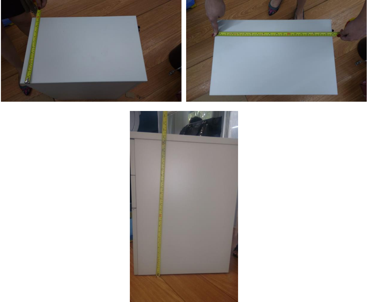
Figuras 04, 05 e 06 – Dimensões do gaveteiro.

O gaveteiro apresenta largura, altura e profundidade compatíveis com o modelo de gaveteiro solicitado, tipo GV 01.