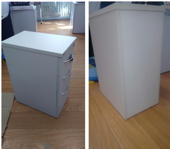
Figuras 09 e 10 – Laterais e Fundo do Gaveteiro.

A base, fundo e laterais do gaveteiro apresentado são confeccionados em MDP com espessura de 18mm, com acabamento em laminado melamínico texturizado e bordas retas, com fita de poliestireno de espessura superior a 1 mm. A montagem das peças se utiliza de acessórios internos e há quatro rodízios fixos no corpo do gaveteiro, que atendem ao especificado em Edital. A frente da última gaveta, bem como as laterais e o fundo cobrem todo o gaveteiro até o limite do piso.