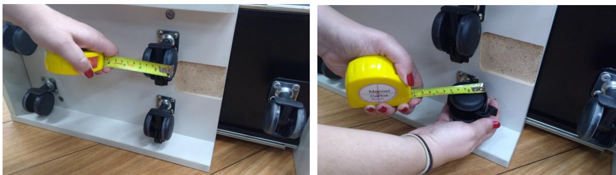
Figuras 11, 12, 13 e 14 – Fundo com 04 rodízios, com 50mm e dispositivo de freio.