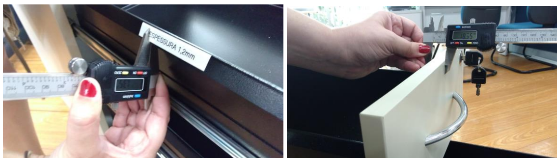
Figuras 17 e 18 – Caixa em aço com 1,20mm e frente em MDP de 18mm.