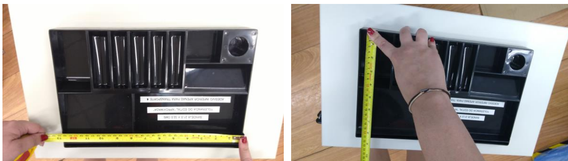
Figuras 19 e 20 – Bandeja de utensílios.

A bandeja está confeccionada com o material especificado, com dimensões 21,5cm x 32,5cm.