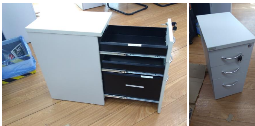
Figuras 15 e 16 – Gavetas fechadas e abertas. O gaveteiro não tomba com as três gavetas abertas.

A frente das gavetas está confeccionada em MDP de 18mm com acabamento em laminado melamínico texturizado e bordas retas, com fita de poliestireno de espessura superior a 1mm. A gaveta inferior possui o 5º rodízio solicitado para evitar o tombamento do gaveteiro. As gavetas estão confeccionadas em aço com espessura de 1,20mm como solicita o Edital e a última gaveta possui caixa interna de altura equivalente a altura da gaveta.