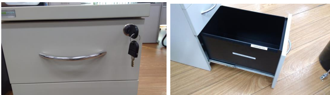
Figuras 21 e 22 – Corrediças e fechadura em conformidade com o Edital. Puxador com dimensões corretas e acabamento cromado.

As gavetas possuem as corrediças, fechadura e sistema de fechamento e travamento como solicitado no Edital.