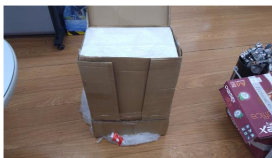
Figuras 01, 02 e 03 – Abertura do pacote, às 10h desta data.