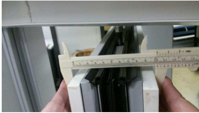
FIGURA 06 – divisória articulada multidirecional com 100mm de espessura