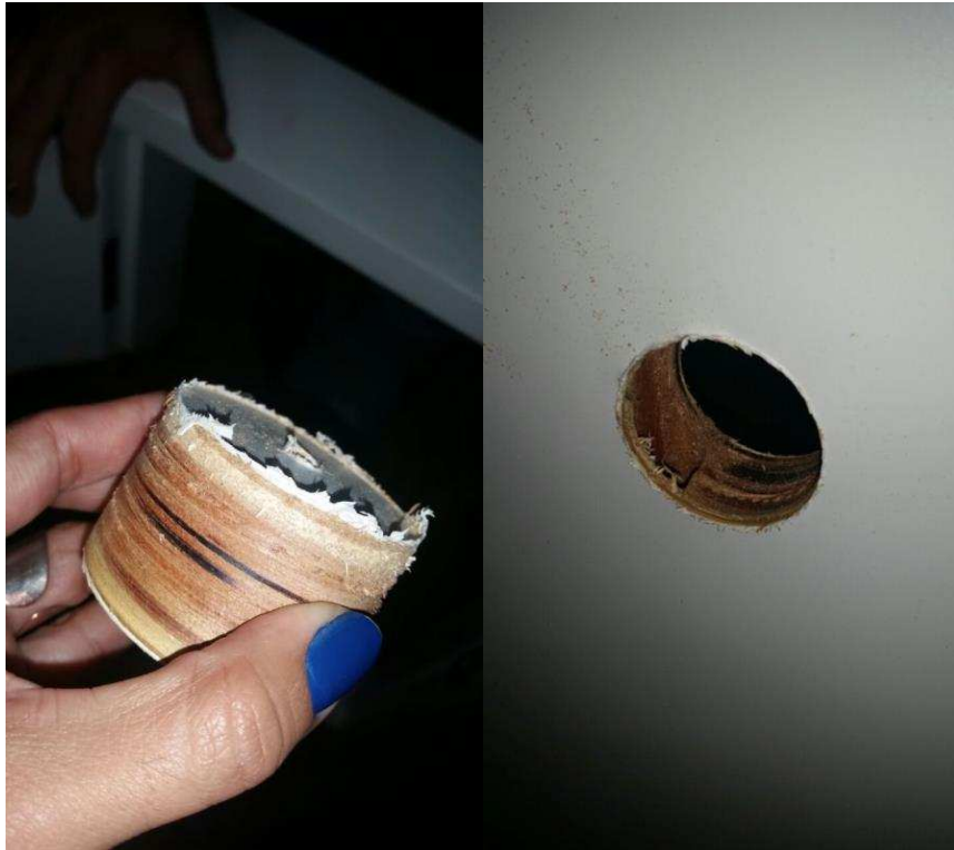
FIGURA 10 – Porta para áreas molhadas – encabeçadas por laminado pet, requadrada com madeiras maciça e contraplacada em ambas as faces com chapa de compensado de espessura mínima de 4mm