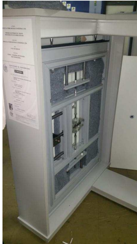
FIGURA 08 – divisória articulada multidirecional – mecanismo interno