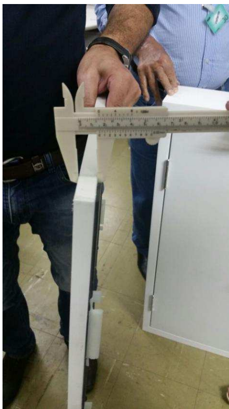
FIGURA 04 - Chapas em MDF, de 15mm de espessura, de saque frontal individual