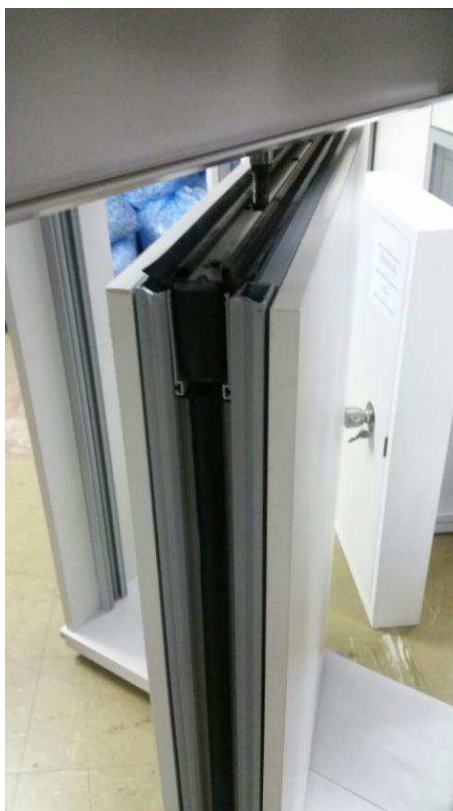
FIGURA 05 – divisória articulada multidirecional