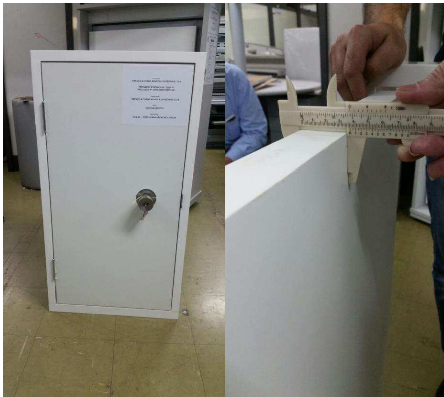
FIGURA 09 – Porta para áreas molhadas