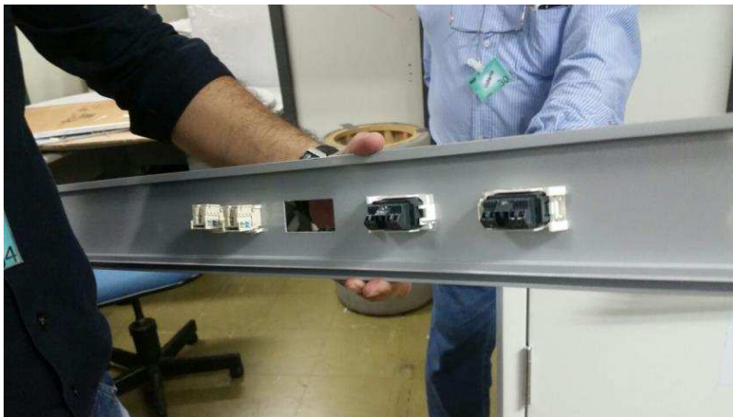
FIGURA 03 – Rodapé fixados por encaixe, sem parafusos aparentes, permitindo instalação de tomadas elétricas