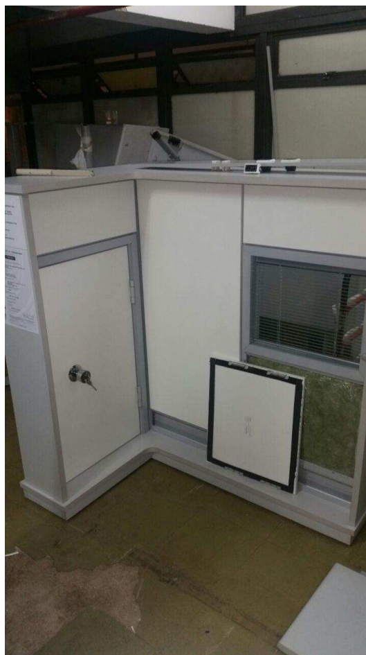
FIGURA 01 – Divisórias especial laminado melamínico (porta, painel cego e painel com vidro duplo e mini-persiana)