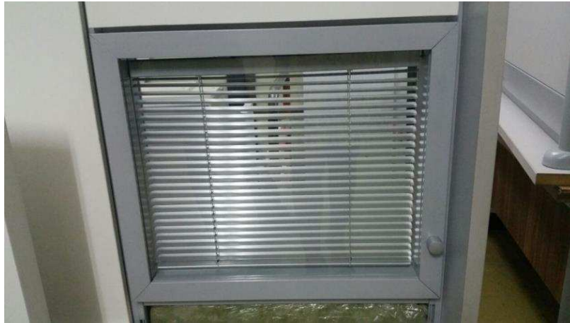
FIGURA 02 – Mini-persiana